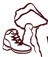
Ausblick Gelersteine-Tour

Tourist-Info-Zentrum Pfälzerwald Schuhmeile 1 · 76846 Hauenstein · Tel. 06392 9233380 www.urlaubsregion-hauenstein.de