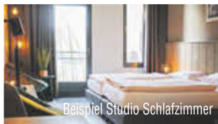
Beispiel Studio Schlafzimmer