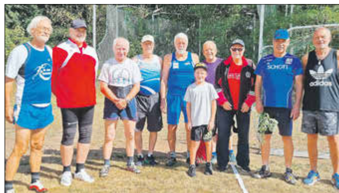
Einige dieser „Oldies“ werden auch in diesem Jahr wieder dabei sein.