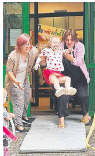
„Kindergarten reicht mir nicht mehr“: sagt das angehende Schulkind und „fliegt“ aus dem Spatzennest.