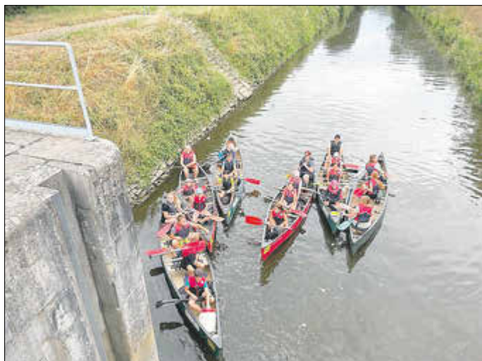
Die Landteens trotzten Materialermüdung und Regenschauer und haben Spaß auf der Lahn.

Von diesem Ausflug werden die Villmarer Landteens sicher noch länger erzählen: Die Paddeltour auf der Lahn von Fürfurt nach Villmar entwickelte sich für die 17 Mädchen und Jungs nämlich rasant zu einem lustigen Abenteuer, bei dem es viel zu Lachen gab. Glücklicherweise ist keines der Kanus gekentert, allerdings war Materialermüdung im Spiel: In einem der Boote krachte ein Sitz – und trotzdem wurde fleißig weiter mitgepaddelt. Und dann machte auch noch das Wetter Querelen, denn Petrus konnte sich nicht entscheiden und schickte einfach alles vom Himmel: Sonnenschein und Regen. Aber die Landteens waren sich einig, dass es ein toller und wirklich abenteuerlicher Tag war, der wiederholt werden darf. Die Landteens werden betreut von drei engagierten Vorstandsmitgliedern der Villmarer Landfrauen. Seit Beginn des Jahres ist die große Gruppe der Villmarer Landkids in zwei Altersgruppen aufgeteilt, um altersgerechte Angebote machen zu können.