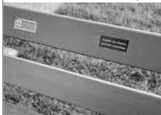
An der Vogteikapelle

Sich auf unseren Bänken zu verewigen erfreut sich immer größerer Beliebtheit: