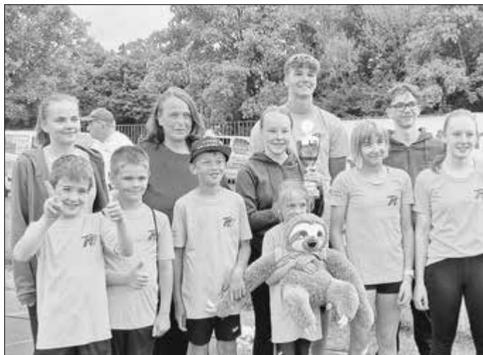
Der TV Niederscheld erhält den Walter-Haas-Gedächtnispokal

Der zweite Tag war geprägt von fairen Wettkämpfen, sportlicher Begeisterung und zahlreichen persönlichen Erfolgen. Die perfekte Organisation durch die Lf Villmar und die tatkräftige Unterstützung von Kampfrichtern, Helfern und Betreuern machten die Veranstaltung zu einem vollen Erfolg. Die vollständigen Ergebnisse der Athletinnen und Athleten des gastgebenden Vereins, der LFV, werden in der nächsten Ausgabe veröffentlicht.