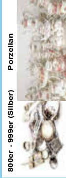
800er - 999er (Silber) Porzellan