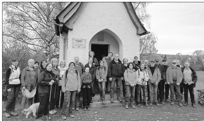
Vor der Wendelinuskapelle

In der Reihe „Die Heimat entdecken, Wandern für ALLE“ waren jetzt 25 Teilnehmer rund um Offheim unterwegs, man lief zur Wendelinuskapelle und sah die wohl älteste Steinbrücke in Hessen und bei der Abschlussrast in der Gaststätte, „Zur Turnhalle“ erfuhren alle noch wie die Offheimer zu ihrem Scherznamen „Bären“ kamen. Die nächste Tour ist am 5.5.24, heißt „Watzenhauer Riesen“ und ist ca.16 km lang. Infos dazu erfolgen wie immer rechtzeitig.