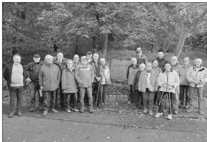
An der notlandestelle des Zeppelins

Die 40 te Tour der Reihe „Die Heimat entdecken, wandern für ALLE“, war eine kleine gemütliche ca. 8 km Tour rund um Linter. Die 22 Teilnehmer liefen durch die Geflügelzuchtanlage, erfuhren dort, das die Einwohner von Linter „Frösche“ genannt werden und das der Zeppelin Z II am 24.4. 1910 hier notlanden musste und sich am nächsten Tag los riss und in Weilburg zerschellte. Der Abschluss war im Café „Denkmal“ in Blumenrod.