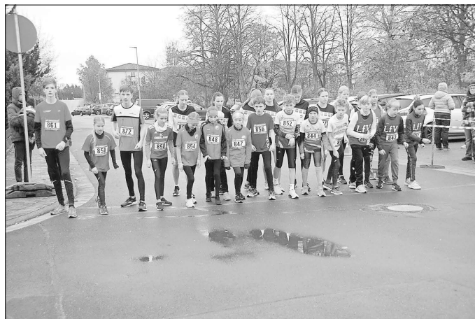
Villmarer Dorflauf 2022: Start 2 km Schüler und Schülerinnen.

Aus Anlass des 30. Villmarer Dorflaufs gibt es nicht nur für jeden Läufer eine Medaille, sondern es sind auch noch einige Überraschungen für Teilnehmer und Zuschauer geplant.