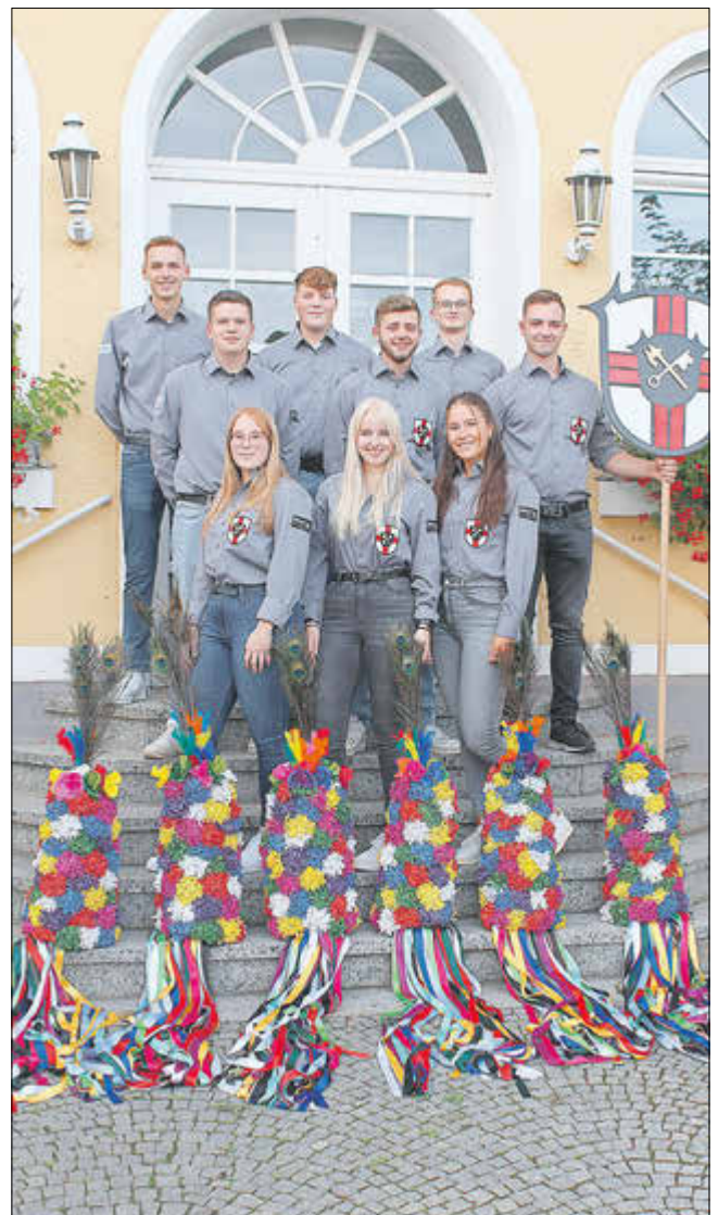
Kirmesburschen und -mädchen Villmar 2023