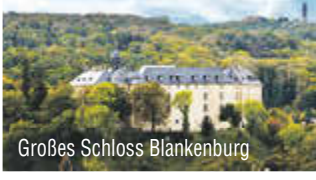
Großes Schloss Blankenburg

Ihr Hotel liegt am Großen Schloss Blankenburg und verfügt über ein Restaurant, eine Konditorei, Wintergarten, Terrasse, Fitnessraum und Aufzug u. v. m.