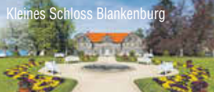
Kleines Schloss Blankenburg