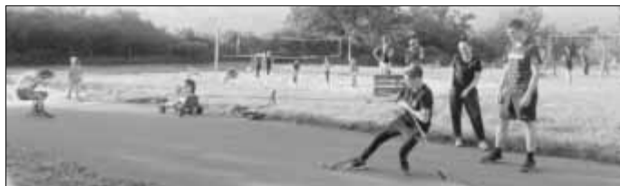
Reges Treiben auf der Anlage der LfV.

Bei Einbruch der Dämmerung klang dann eine schöne, gemütliche und harmonische kleine Feier der LfV aus und alle waren satt und zufrieden.