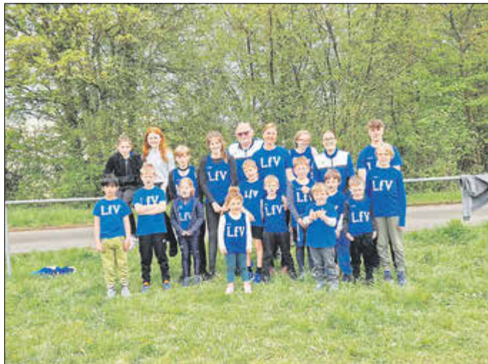
Die LfV-Teilnehmer beim Schüler- und Jugendsportfest 2023 mit ihren Betreuern.

Meldeschluss Dienstag, den 25. April 2023. Spätere Meldungen bis 27.04.2023 sind Nachmeldungen. Danach keine Meldung mehr möglich. Ergebnislisten auf der Homepage der LfV.