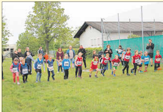
Start des 940 m Laufs