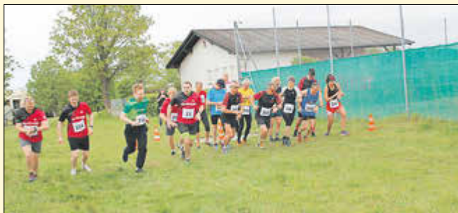
Start der Langstrecke 7 360 m