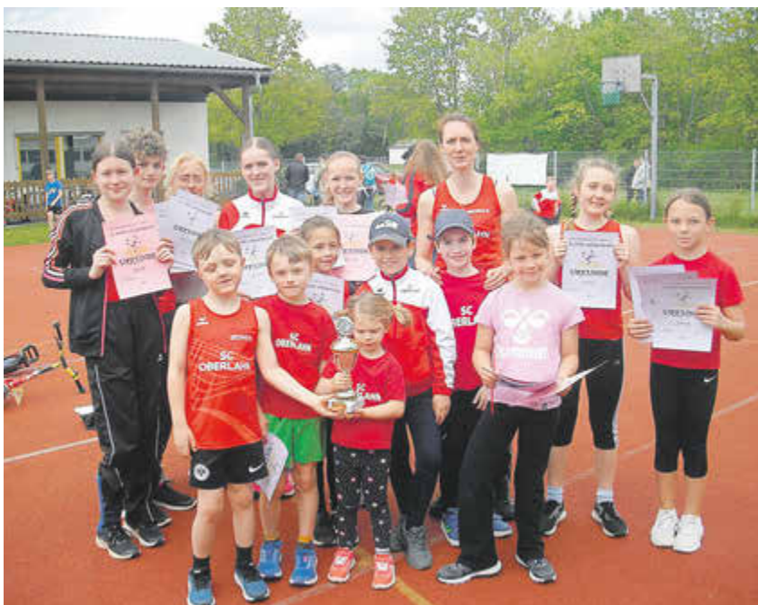
Der Pokal für die meisten Teilnehmer ging an den SC Oberlahn