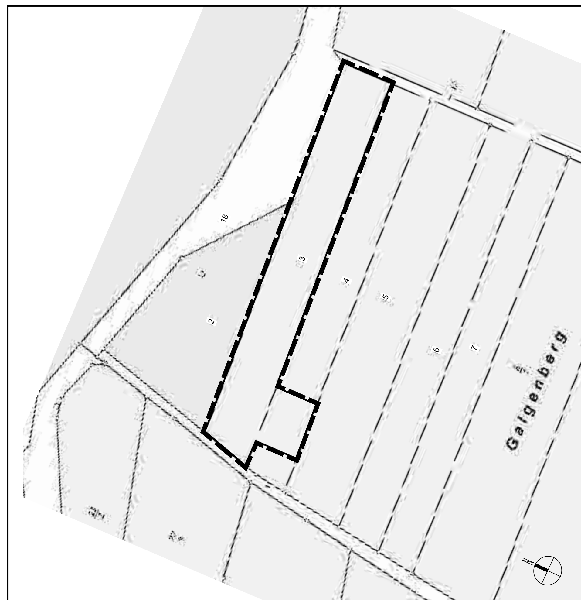
Bebauungsplan der Gemeinde Villmar OT Langhecke - Für das Gebiet "Kirchstraße", M 1:1000