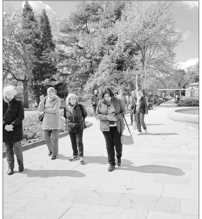
Bei bestem Wetter erkundeten die Landfrauen den Frankfurter Palmengarten und die Innenstadt.

Landfrauen den Lebenszyklus eines Schmetterlings vom Ei über die Raupe und die Puppe bis zum Falter hautnah erleben und sich über das Leben und die Relevanz der Insekten informieren. Nach dem Besuch im Palmengarten zog es die Landfrauen weiter in den Großstadt-Dschungel: So machten sie in kleinen und größeren Grüppchen die Innenstadt unsicher, besuchten Sehenswürdigkeiten und gingen bummeln.