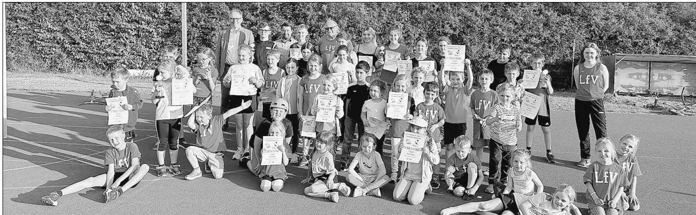
Gruppenbild von den LfV - Vereinsmeisterschaften 2023.